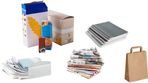
Emballages carton, papier