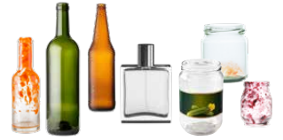
Bouteilles, flacons et pots