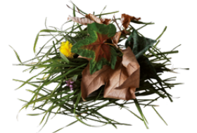
Déchets végétaux du jardin