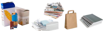
Emballages carton, papier