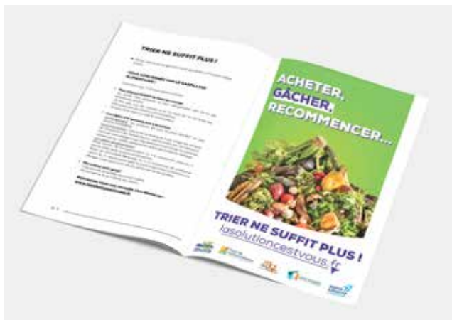
Des kits communication pour les communes du SMICTOM : articles type pour les bulletins municipaux, visuels pour les réseaux sociaux, etc.