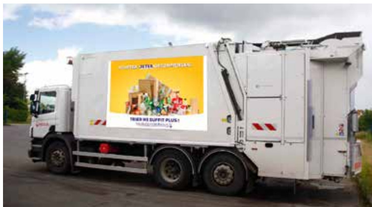
Campagne d'affichage sur les bennes de collecte

Un site internet pour passer en mode zéro déchet