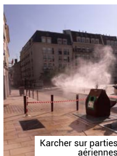
Karcher sur parties aériennes