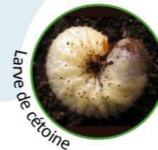
Larve de cétone

Pour les différencier, il y a aussi plusieurs points d'anatomie. La tête de la cétone est bien plus petite que son corps alors que celle du hanneton est normale. De plus, l'extrémité du corps de la cétone est bien grosse et ronde alors que celle du hanneton est plutôt fine. Enfin, la cétone possède des poils sur son dos et elle s'en sert pour se déplacer alors que le hanneton se sert de ses pattes !