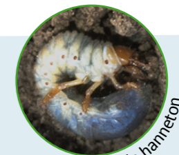
Larve de hanneton