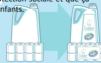
Je choisis des produits écolabellisés

A contrario, un produit qui vient d'un pays avec une législation moins contraignante ne vous garantit pas les conditions de travail, une protection sociale et que ça n'a pas été fabriqué par des enfants.